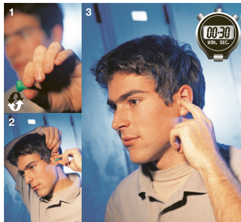
2 Uso corretto degli inserti auricolari

8 Avete valutato la possibilità di incapsulare le macchine molto rumorose (fig. 4)? sì in parte no