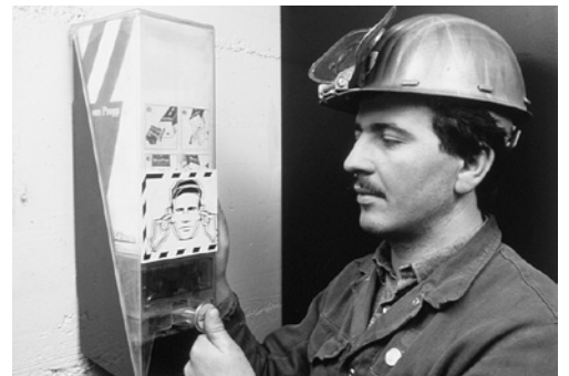
7 Dispenser. I protettori auricolari devono essere sempre a portata di mano.