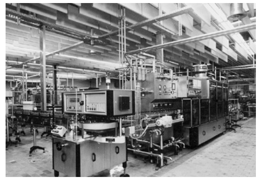
5 Baffle costituiti da pannelli di lana minerale in una ditta produttrice di bevande (impianto di imbottigliamento)