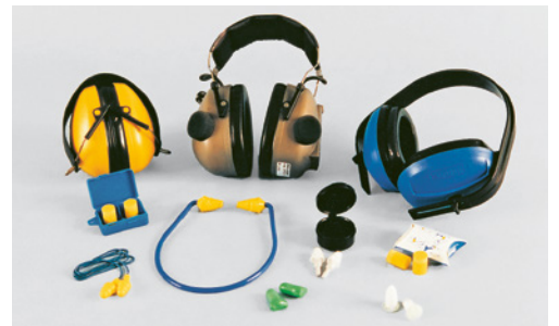
6 Protettori auricolari di vario tipo