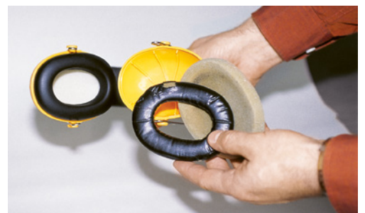
8 Usare e conservare accuratamente le cuffie antirumore.

«Napò – Stop al rumore!», film di sensibilizzazione rivolto ai lavoratori: www.suva.ch/rumore > Materiale > Video